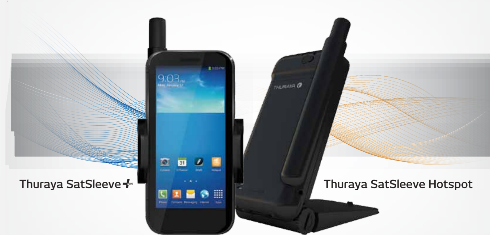
Thuraya SatSleeve plus

C'est votre monde. Votre téléphone. Votre choix.