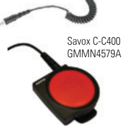
Savox C-C400 GMMN4579A

Complétez la solution avec l' unité de commande de communication Savox C-C400 qui permet d'utiliser vos radios dans les environnements dangereux. D'une conception robuste pour les environnements les plus extrêmes, le bouton PTT (push-to-talk) extra large permet de communiquer sous l'équipement et les vêtements de protection.