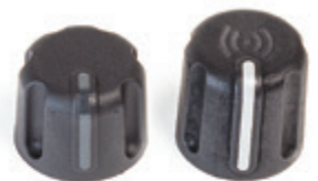
Bouton de commande standard Bouton de commande RFID

◀ Bagues d'identification colorées optionnelles pour les groupes affectés à différentes missions, zone de couverture ou équipes.