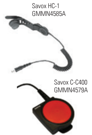
Savox HC-1 GMMN4585A

Le Savox HC-1 est un dispositif compact qui se fixe sur le casque pour les professionnels travaillant dans des environnements dangereux. Idéal pour les pompiers et les sauveteurs, il se fixe facilement sur la majorité des casques et offre des communications claires et mains libres.