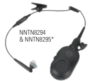
NNTN8294 & NNTN8295*

L'audio Bluetooth 2.1 est intégré dans la radio pour permettre une connexion rapide et sécurisée à de nombreux accessoires Bluetooth. Faciles à fixer et à connecter, les accessoires Bluetooth Motorola Solutions renforcent votre performance et votre sécurité en toutes circonstances. Les agents peuvent communiquer discrètement, se déplacer sans fil et découvrir de nouvelles façons d'utiliser leur radio.