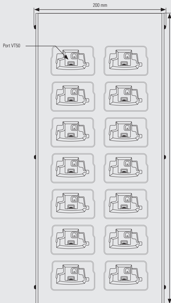
Vue du dessus